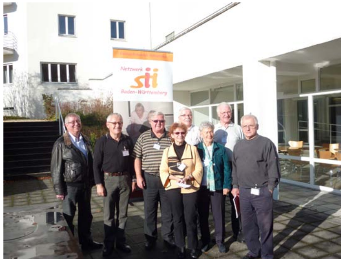
Der Vorstand des Vereins